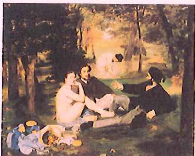
Nom de l'oeuvre : LE DEJEUNER SUR L'HERBE

/01 . A quel mouvement pictural cette oeuvre appartient-t-elle?