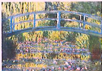
C. Monet 1899 «Le pont japonais»

/4,5 . Après observation des oeuvres ci-contre identifiez et décrivez la qualité du traitement de la lumière, issue d'une étude en plein air :