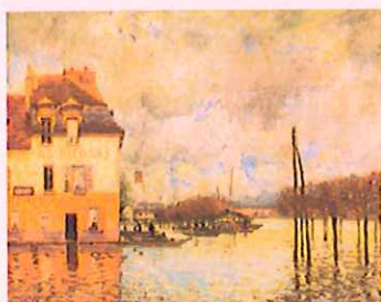
A. Sisley 1876 «Inondation à port-Marly»