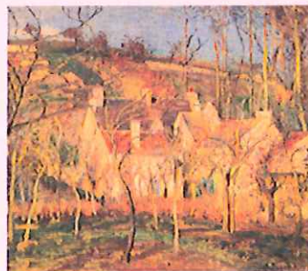
C. Pissaro 1877 «Les toits rouges effets d'hiver»

Les Impressionnistes saisissaient l'instantanéité de la lumière, ils peignaient sur le «motif» , c'est-à-dire sur place. Sur ces trois tableaux on peut situer la saison et l'heure auxquelles ces oeuvres ont été peintes. Même s'ils terminaient leurs tableaux en atelier, les peintres impressionnistes devaient saisir très rapidement la qualité de la lumière . Pour ce faire ils travaillaient par touches rapides, avec une pâte épaisse, souvent posée au couteau ce qui donnait une peinture lâchée .